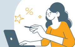
Website or app

If you are not satisfied with the resolution or it has not been addressed within 30 calendar days, you can submit a complaint to Sanadak.